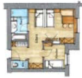
(Grundrisse sind schematisch, Abweichungen möglich)

Preis pro Person und Tag Price per person and day