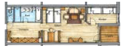
(Grundrisse sind schematisch, Abweichungen möglich)

Preis pro Person und Tag Price per person and day