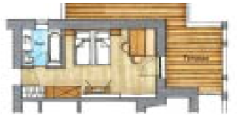
(Grundrisse sind schematisch, Abweichungen möglich)

Approx. 32 m 2 with hallway | Living-sleeping room with seating area King size box spring bed | Bathroom with bathtub and lavatory | South-facing balcony | Flat screen TV, Telephone, Wi-Fi, safe, minibar, espresso machine with tea-making facilities | Built-in baby and child monitor