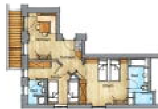
(Grundrisse sind schematisch, Abweichungen möglich)

Preis pro Person und Tag Price per person and day